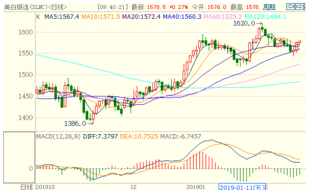
图 2：COMEX 白银主力合约技术分析

COMEX 白银上周表现较弱，也是先跌后涨，技术指标显示下跌动能减弱，本周或震荡上涨。